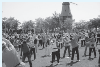
◆グラウンド・ゴルフ大会◆

ご近所で同じ趣味を持つ仲間と出会いたい方、なにか新しいことを始めたい方、地域でいきいきと活動したい方の入会をお待ちしております。