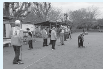
◆ゲートボール大会◆